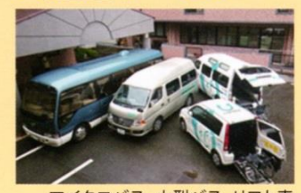
マイクロバス、小型バス、リフト車

マイクロバス、小型バス、車 イス対応リフト車により、ご自 宅⇄デイサービスの送迎を 安全運転で行います。