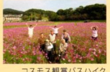
コスモス観賞バスハイク